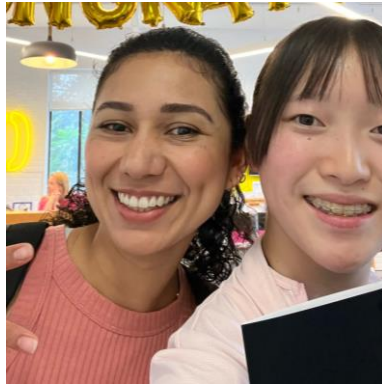
授業後、シドニー各地を案内してくれたコロンビア出身の先生