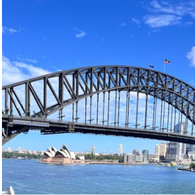
シドニーのオペラハウスとハーバーブリッジ